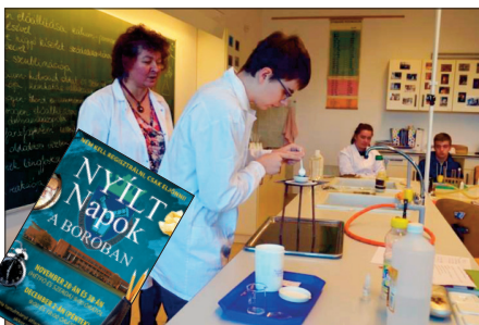
Kémiai kísérlet a bemutató órán

Októberben jelent meg a HVG külön-száma a középiskolák rangsoráról . Ebben iskolánk a szakgimnáziumi (korábban szakközépiskola) kategóriában ISMÉT első lett , az elmúlt öt évben immáron harmadszor. A kiadvány összeállítói a nyilvánosan is elérhető, OH adatokat használták fel: kompetenciamérés eredményei, középszintű érettségi átlagai a kötelező tantárgyakból (magyar nyelv és irodalom, történelem, idegen nyelv és matematika), végzősök nyelvvizsga- és továbbtanulási aránya. A szempontrendszeren mindig lehet vitatkozni, de miért mi tennénk, ha elsők lettünk a saját kategóriánkban. Hát, talán azért, mert készült egy minden iskolát tartalmazó lista is, ahol „csak” a 84. helyre lettünk rangsorolva a több, mint 900 magyarországi középiskola közül. A gimnáziumok számára jelentős előnyt biztosított a szempontrendszer, hiszen például a négy kötelező érettségi tantárgyból három humán, amelyek nem feltétlenül erősségei a fiú többségű és műszaki beállítottságú iskoláknak. A vizsgált szempon-