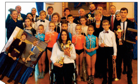
A sportkarácsony díjkiosztóján