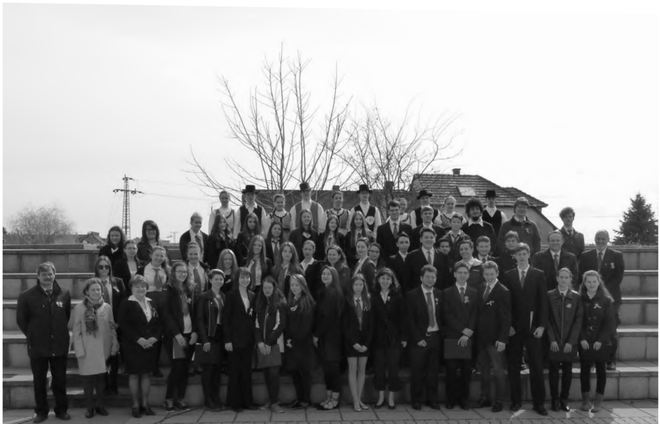
Március 15-i ünnepség