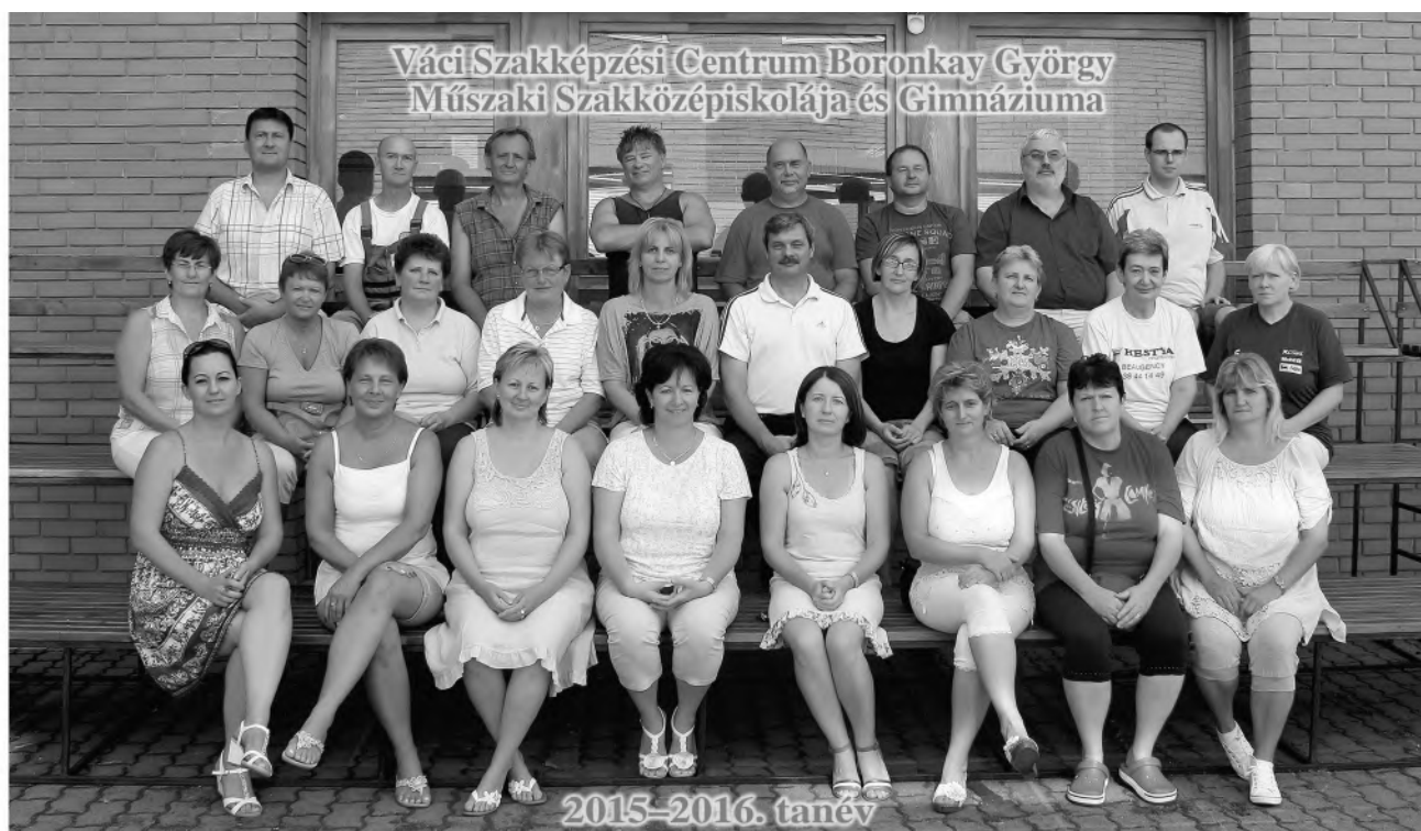
Technikai dolgozók csoportképe