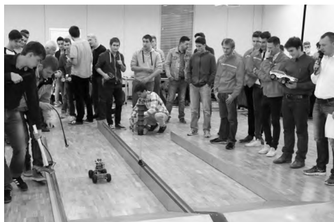
Audi Kreativity Verseny