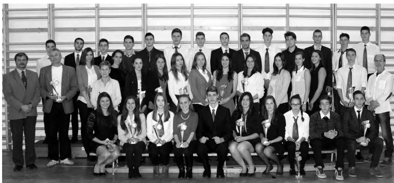
A váci diákolimpikonok ünnepe - 2015