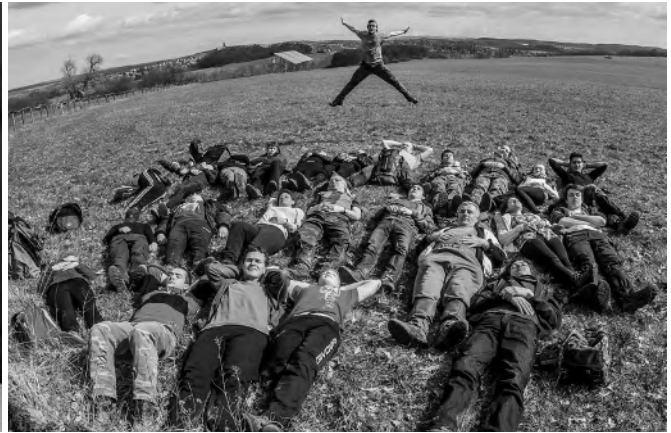
Tavaszi túra a Börzsönyben