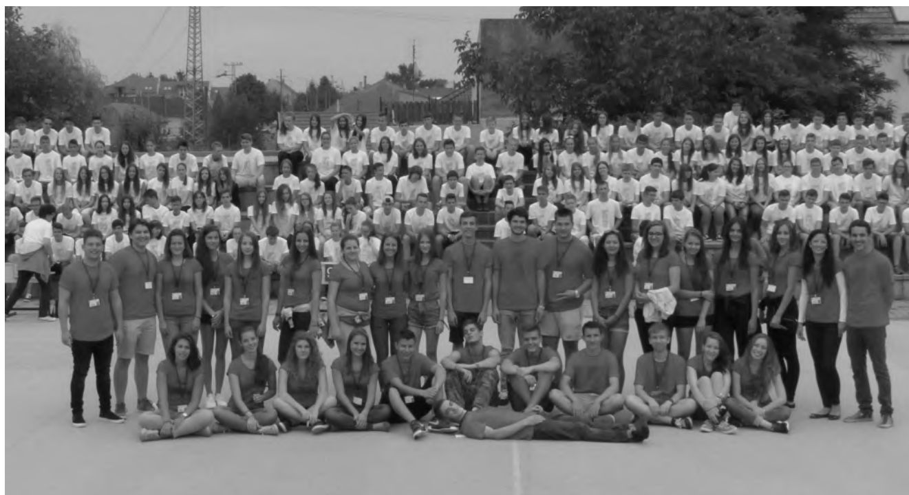
Diákönkormányzatunk tagjai 2015-2016

A tanév egyik, a diákok által már várt záróeseménye, hogy ők is pontozhatják az őket tanító tanárok tevékenységét, előre megadott hét szempont alapján. Természetesen az értékelésbe vegyül némi szubjektivitás, de a dolgnak nem is az a lényege, hogy az értékelésnek a tanárra nézve bármilyen következménye legyen, hanem a véleménynyilvánítás komolysága és felelőssége, valamint visszajelzés a pedagógusoknak. Ezt a felmérést 2008 óta végezzük. Az értékeléseket a tanárok is kézbe kapják (mindenki csak a sajátját), így össze tudják hasonlítani az előző tanév adataival. Kategóriánként a 3-3 legtöbb pontot kapott tanár a tanévnyitó ünnepségen egy elismerő oklevelet vehet át, melyet a diákok részéről lelkes taps és ováció szokott kísélni.