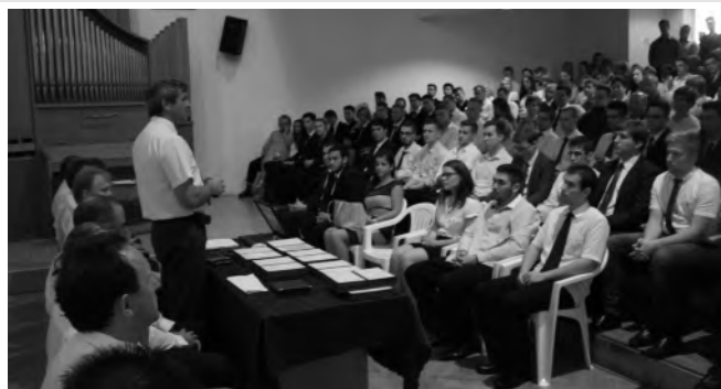
Technikus avató ünnepség