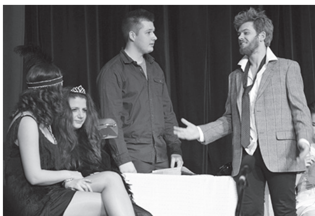
Boronkaysok színházi előadása