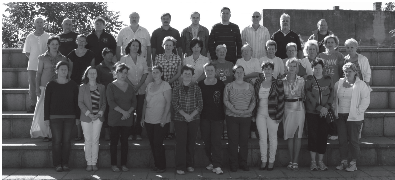
Technikai dolgozók csoportképe