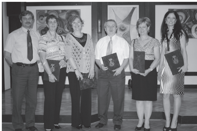
Vác Város kitüntetett tanárai