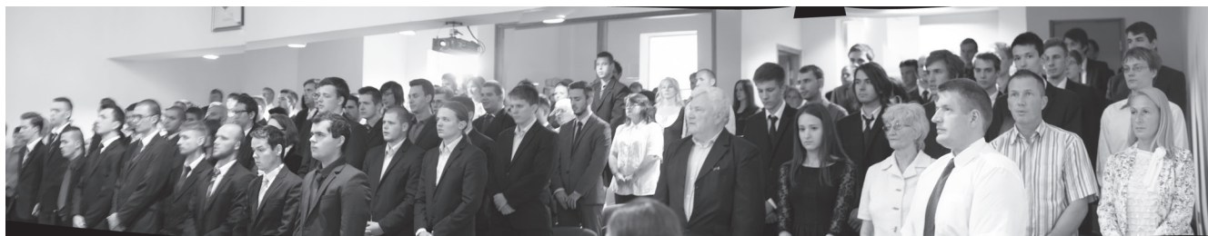
Technikus avató ünnepség