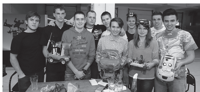
AUDI Kreativity csapatunk

A közismereti tantárgyak eredményességét illetően kiemelkedik a matematika, amely egyrészt a sokféle versenynek, másrészt a műszaki jellegű képzésünkhöz igazodóan a tantárgy fontosságának tulajdonítható. Ebből a tantárgyból az országos összesített rangsor alapján is (beleértve az elit gimnáziumokat is) az igen előkelő 2. helyen állunk. Szerencsére azonban a többi tantárgy is sorra országos szintű eredményeket tud felmutatni tanáraink kiváló tehetséggondozó munkájának köszönhetően.