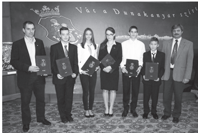
Vác Város kitüntetett diákjai

Iskolánkban egy komoly és összetett elismerési rendszer alakult ki az évek során. Ezen belül külön kategóriát képeznek az éppen ballagók által átvettek, hiszen az ő esetükben nem egy tanév, hanem a nálunk eltöltött idő egészét vesszük figyelembe. Külön emeli az átadás fényét, hogy ez több ezer ember előtt a ballagási ünnepségen történik. Legmagasabb szintű elismerésünk a „Boronkay Emlékérem”, amelyre pályázni kell, és egy előre meghatározott pontrendszer szerint rangsoroljuk a diákokat. Itt pl. 100 pontot ér egy OKTV győzelem, s 10 pontot egy kiváló tanulói cím. El lehet ezek után képzelni, milyen teljesítmények voltak díjazott diákjaink mögött, ahol már csak a jelöléshez is minimum 260 pontot kellett elérni.