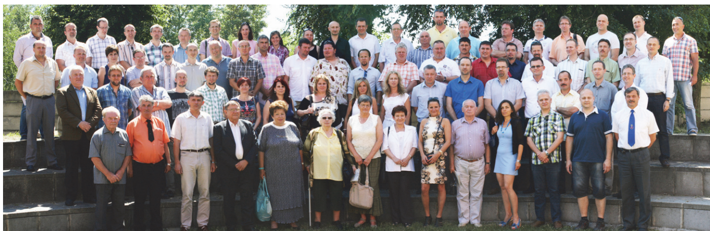
2015. június 6. - A 25 éve végzetek (1990) évfolyam-találkozásán készült csoportkép