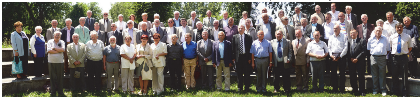
2015. május 30. - Az 50 éve végzetek (1965) évfolyam-találkozásán készült csoportkép