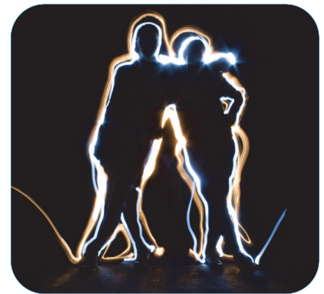
Füzesi Tamás: Fényfestés