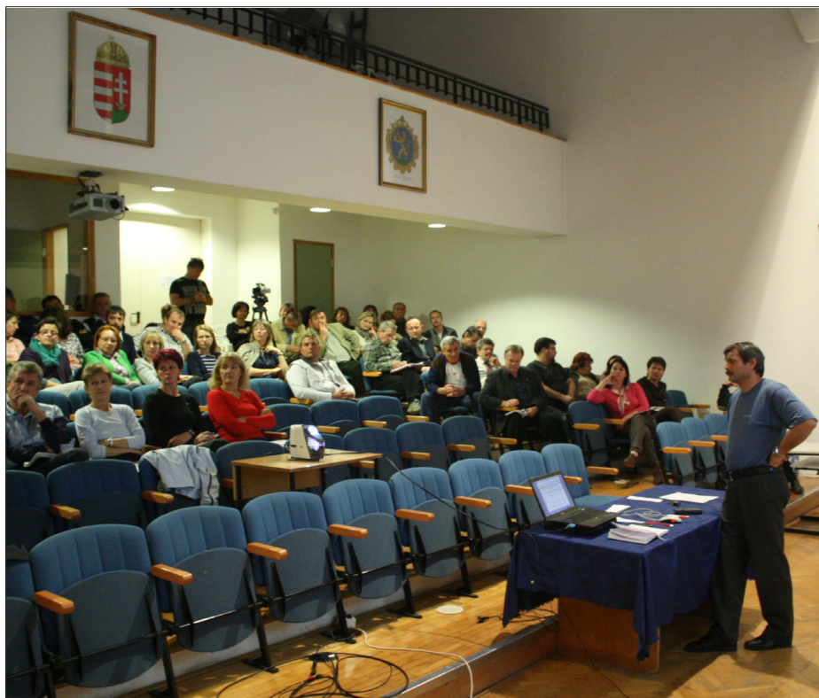
Tanári értekezlet a fenntartóváltásról