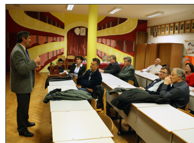
Boronkay Baráti Kör találkozója 2013. november 5-én