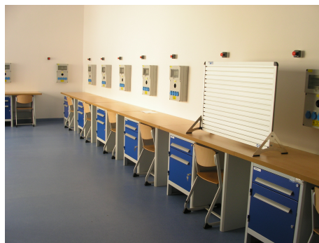
Villamos automatika mérőlabor